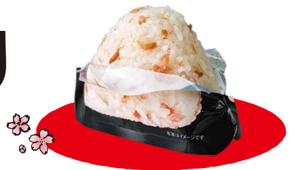
携帯おにぎり鮭のできあがりイメージ