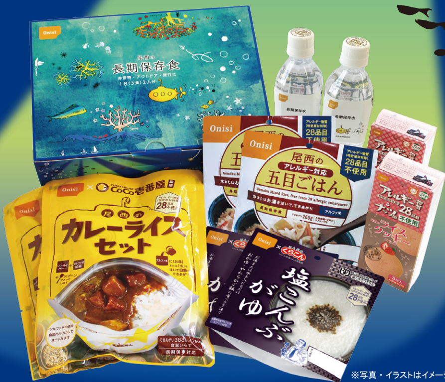
※写真・イラストはイメージ