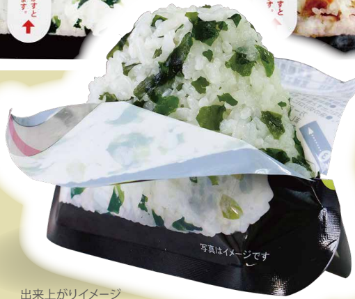
出来上がりイメージ (写真は携帯おにぎりわかめです)